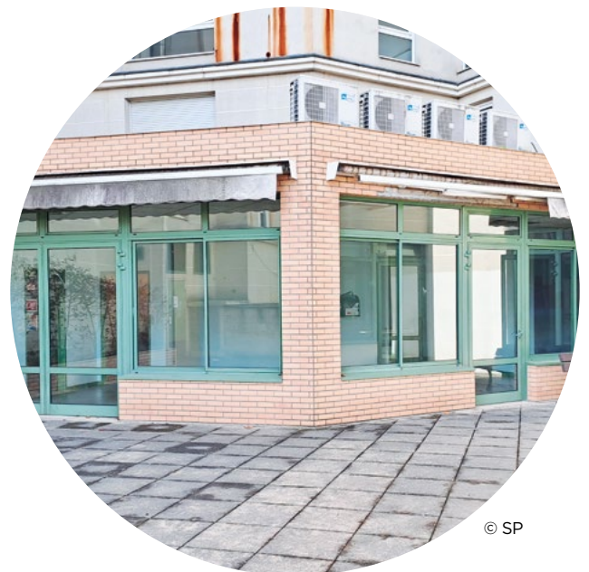
Vue façade et espace du rez-de-chaussée

La Société Philanthropique entretient depuis longtemps de bonnes relations avec la ville de Clichy-sur-Seine (92), notamment concernant l'hôpital Goüin. C'est donc naturellement que la municipalité s'est tournée vers l'Association lorsqu'elle a souhaité vendre la Résidence Vergnes située rue du Landy. Cet immeuble comporte une quarantaine de logements — dont une trentaine occupés — ainsi qu'un espace de 300 m 2 au rez-de-chaussée dédié à l'accueil de personnes âgées. Racheté fin 2025 par la Société Philanthropique, la Résidence Vergnes aura vocation à être transformée en résidence sociale pour y accueillir des femmes seules ou avec enfants de moins 12 ans. Quant à l'espace du rez-de-chaussée, il est destiné à devenir un tiers lieu accueillant des activités ouvertes sur le quartier et sur la ville de Clichy. Il bénéficiera également directement à l'Association comme espace de réunion et de formation.