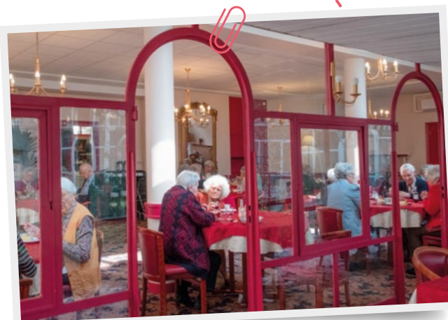
Le restaurant de la Résidence Marthe-André Lucas