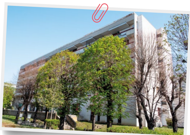
La Résidence Greffulhe