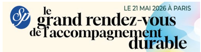
Bannière de l'évènement

Cinq ans après la Fête des salariés qui s'était déroulée Salle Wagram à Paris en présence de 600 professionnels et membres de l'Association, la Société Philanthropique organise un nouvel événement de grande ampleur. Son intitulé ? Le Grand rendez-vous de l'accompagnement durable, qui se tiendra le 21 mai après-midi à la Cité Universitaire de Paris (14 e ). Environ 450 participants devraient se retrouver, dont de nombreux invités externes à l'Association : représentants des administrations, élus, partenaires associatifs... En interne, l'ensemble des cadres de l'accompagnement et du soin seront présents ainsi qu'une centaine de professionnels de terrain et des membres et administrateurs de la Société Philanthropique. Cet événement sera l'occasion de présenter une