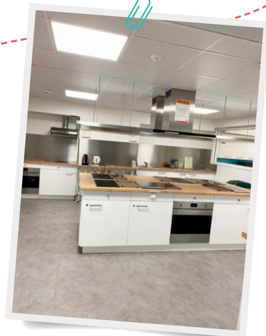
La cuisine de du Foyer des Feuillantines rénovée

au WiFi et l'état des cuisines (pour les FEJA) sont pointés du doigt. Des critiques entendues puisque les FEJA ont amélioré depuis l'accès au wifi en changeant de prestataire et ont entrepris des travaux de réfections complètes des cuisines des trois foyers. Au final, si le niveau de satisfaction global exprimé est plutôt bon la limite du questionnaire reste le faible nombre de réponses : 69 sur 980 ménages sollicités. L'enquête 2026 devra ainsi améliorer le taux de retour afin de permettre aux LVS et FEJA de disposer de données fiables. X