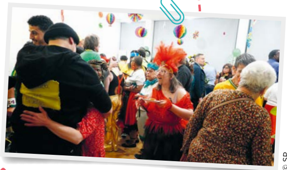
Le défilé des maisons de couture.

Cette Fashion Week a pris l'allure d'un voyage grâce aux costumes, aux décorations, aux spécialités culinaires et aux danses qui ont plongé