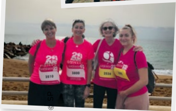
▲ Des sourires après la course, devant le château de Vincennes et sur la croisettes à Cannes