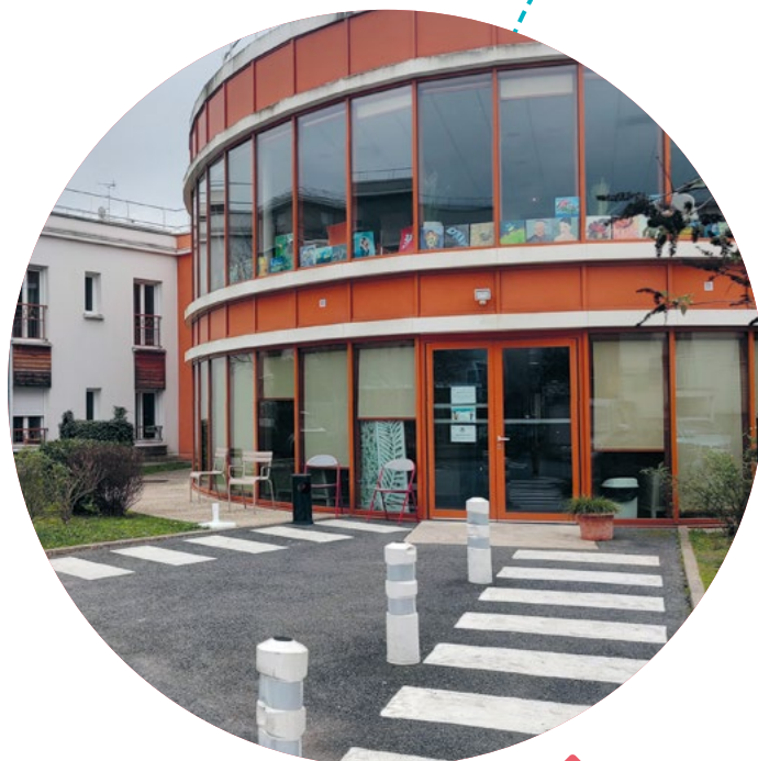
L'EAM Serge Dassault Corbeil