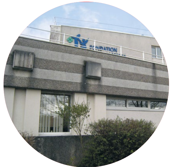
↗ L'EAM & EANM Serge Dassault Mennecy