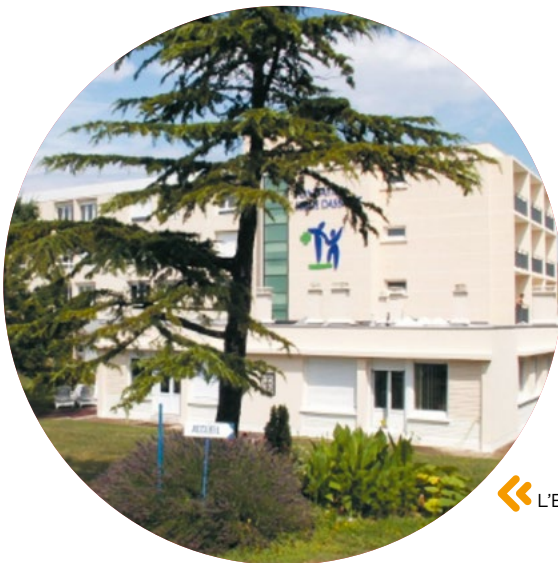
◀ L'EANM Serge Dassault La Dauphine

(1) EAM : Etablissement d'accueil médicalisé. EANM : Etablissement d'accueil non-médicalisé.