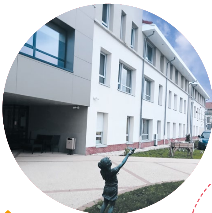
Le Bureau administratif

a été créé en 2013. Il s'agit d'une MAS (Maison d'Accueil Spécialisée) de 40 places qui reçoit des personnes adultes lourdement handicapées.