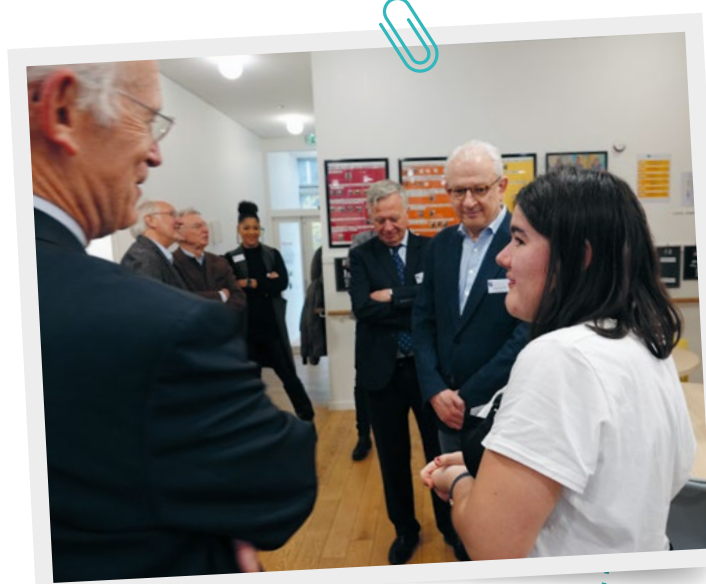
▲ Des administrateurs échantent avec une personne accueillies au CAJ Saint-Joseph.

Les membres du Comité d'administration décident des grandes orientations de l'association. Mais pour prendre les bonnes décisions, ils ont besoin de connaître le fonctionnement des établissements, d'échanger avec leurs équipes, de mesurer leurs atouts et leurs difficultés... C'est pour cette raison qu'une visite du Comité d'administration de l'association a été organisée le 23 novembre à l'EANM Saint-Joseph (Paris 20 e ), un établissement ouvert aux adultes en situation de handicap intellectuel et/ou psychique qui comporte un foyer de vie de 36 places et un accueil de jour de 24 places. L'équipe et les résidents de Saint-Joseph avaient organisé à cette occasion, pour le groupe d'administrateurs présents, une visite guidée très complète des différents services. Le déjeuner avait été préparé par le groupe de l'accueil de jour et partagé en toute convivialité avec ses membres. Un temps très sympathique ponctué par une belle prestation de la chorale de Saint-Joseph. x