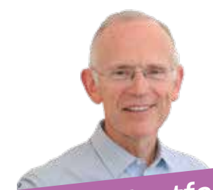
Louis de Montferrand