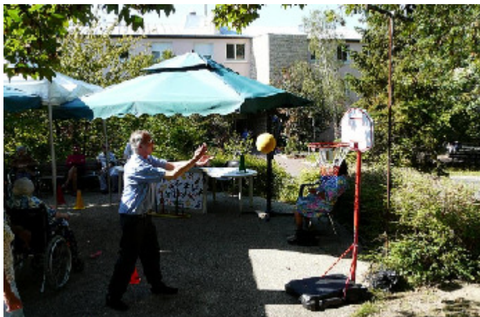
Olympiades des résidents