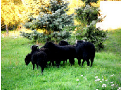
Le parc animalier et les moutons d'Ouessant