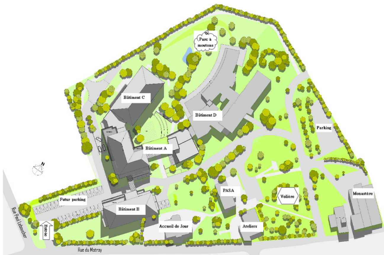
Plan de masse de l'établissement

L'établissement est situé dans le centre de Corneilles en Paris, à proximité des commerces, et bénéficie d'une situation géographique privilégiée dans un parc arboré et fleuri de 2,5 hectares soigneusement entretenu avec une vue magnifique sur la forêt de Saint-Germain-en-Laye. Au gré d'une promenade dans le parc, vous découvrirez la volière avec poules et coq ainsi que le parc animalier avec ses moutons d'Ouessant.