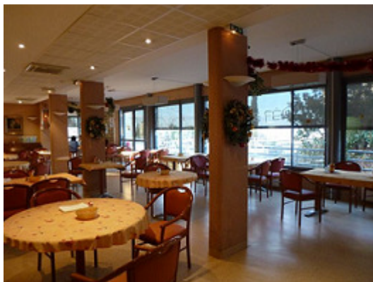
Salle à manger du bâtiment D

Voici des photos de quelques espaces collectifs dans lesquels vous pourrez vous rendre au cours de votre séjour.