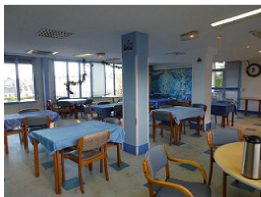
Salle à manger du bâtiment B