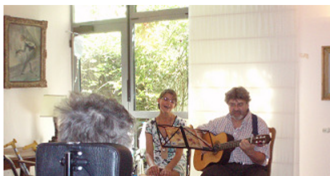
Après-midi russe hebdomadaire

L'établissement perpétue la tradition russe, notamment au travers d'animations spécifiques (chants, lecture de poèmes...) ouvertes à tous.