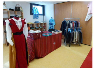
Salle Orient-Express (lors du défilé de mode)