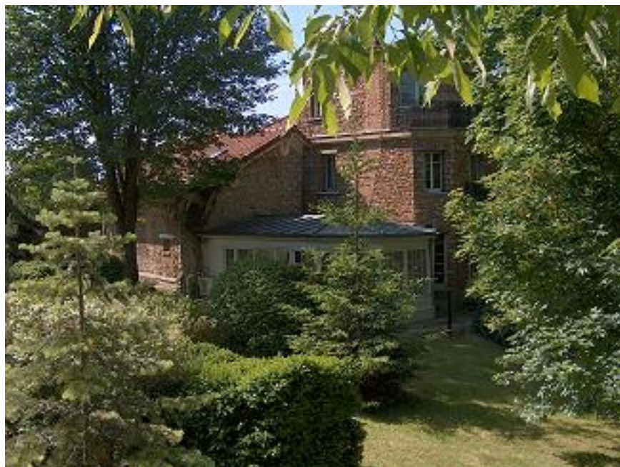
Le bâtiment de l'accueil de jour

La résidence est un Etablissement d'Hébergement pour Personnes Agées Dépendantes (EHPAD) qui a signé sa deuxième convention tripartite le 30/12/2008, pour la période 2009-2013.