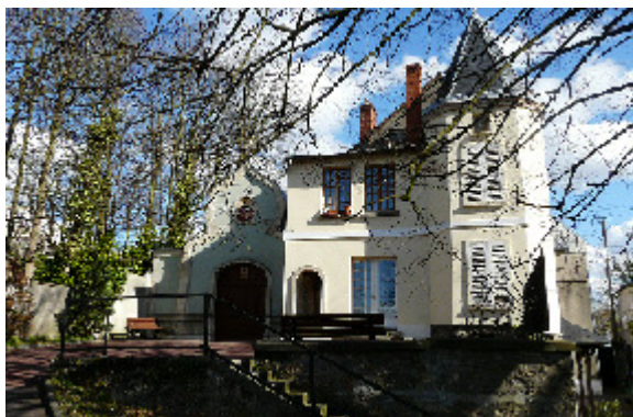
Bâtiment "Le Monastère"

Elles sont accessibles à tous. Les jours et horaires des offices sont affichés dans les pavillons. Sur demande auprès de l'Infirmière responsable du pavillon ou du gouvernant, il est possible de vous mettre en relation avec les représentants des différents cultes mais aussi de recevoir la visite du service évangélique des malades (SEM) avec lequel l'établissement a passé convention.