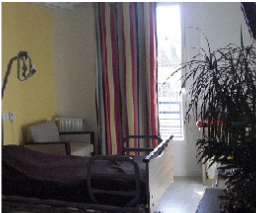
Chambre individuelle (bâtiment A)

Les animaux de compagnie ne sont pas admis.