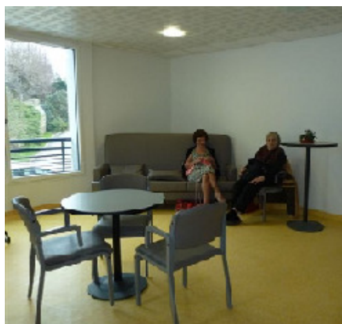
Cafétéria sur la "Place du Village" au bâtiment A, face à l'accueil

Lors de l'admission, un contrat de séjour définissant les objectifs et la nature de la prise en charge sera signé par les deux parties et le règlement de fonctionnement sera remis.