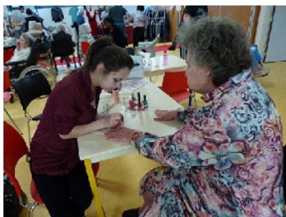
Activité bien-être (massage des mains et pose de vernis)

L'établissement perpétue la tradition russe, notamment au travers d'animations spécifiques (chants, lecture de poèmes...) ouvertes à tous.