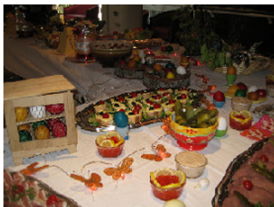
Buffet russe servi pour les fêtes de Pâques

Lors des fêtes traditionnelles, la cuisine prépare de délicieux mets.