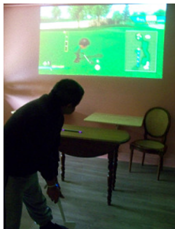
Animation "Wii" : partie de golf