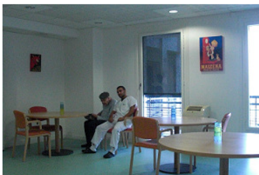
Salle à manger du bâtiment A