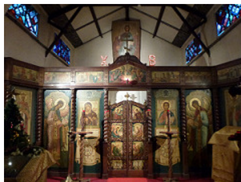
Chapelle orthodoxe Saint Nicolas