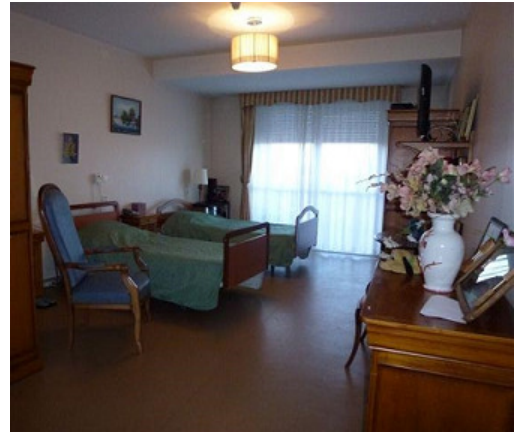
Chambre double (bâtiment D)

Le lit, le matériel de prévention des escarres et les appareils de transfert sont obligatoirement ceux fournis par l'établissement.