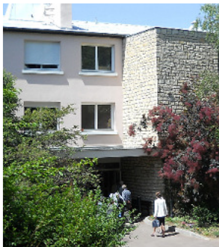
Entrée du bâtiment D

Un dossier d'admission est remis avec ce livret d'accueil. Il comporte un volet administratif à remplir par le résident ou son représentant légal et un volet médical à faire remplir par le médecin traitant habituel. L'ensemble doit être retourné complété au service des admissions, le questionnaire médical sous pli cacheté.